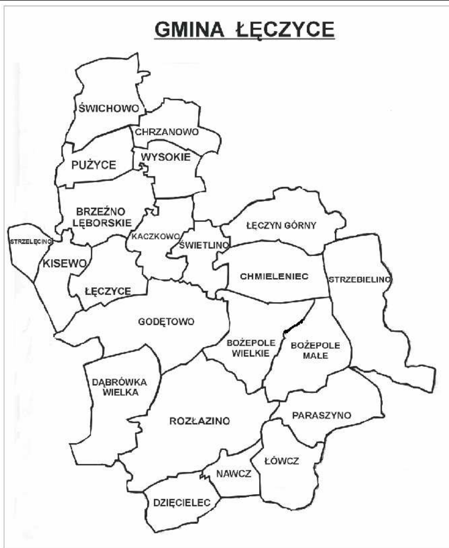
RYSUNEK NR 2 Mapa gminy Łęczycy.