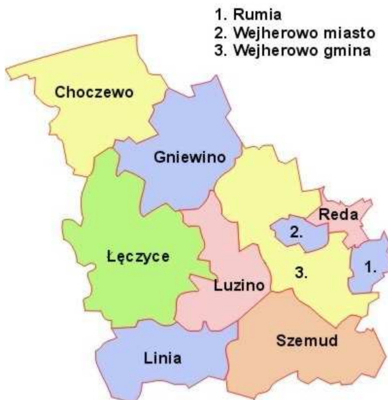
RYSUNEK NR 1 Położenie gminy Łęczyce na tle powiatu wejherowskiego.