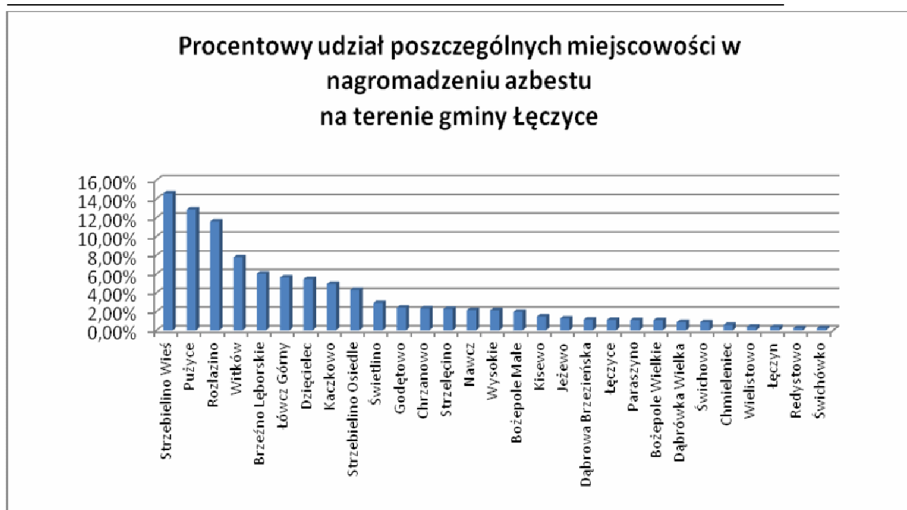
WYKRES NR 1 Procentowy udział poszczególnych miejscowości w gminie Łęczyce.